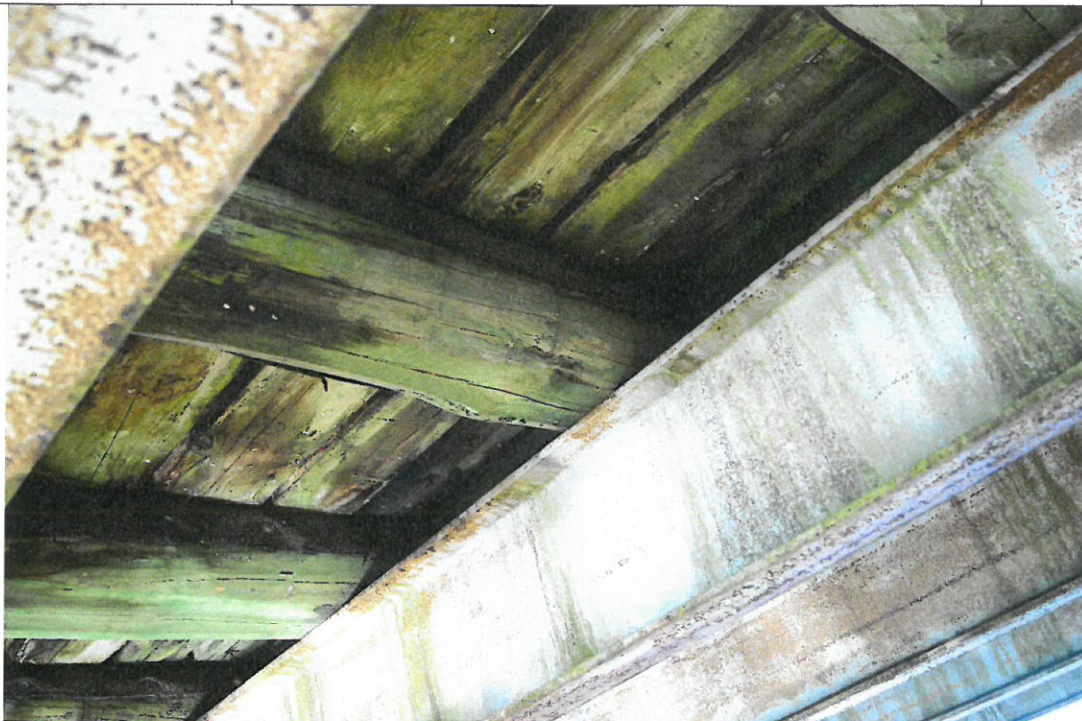
Fot. 4. Korozja dźwigarów stalowych oraz widoczne przecieki przez pokład drewniany – brak izolacji