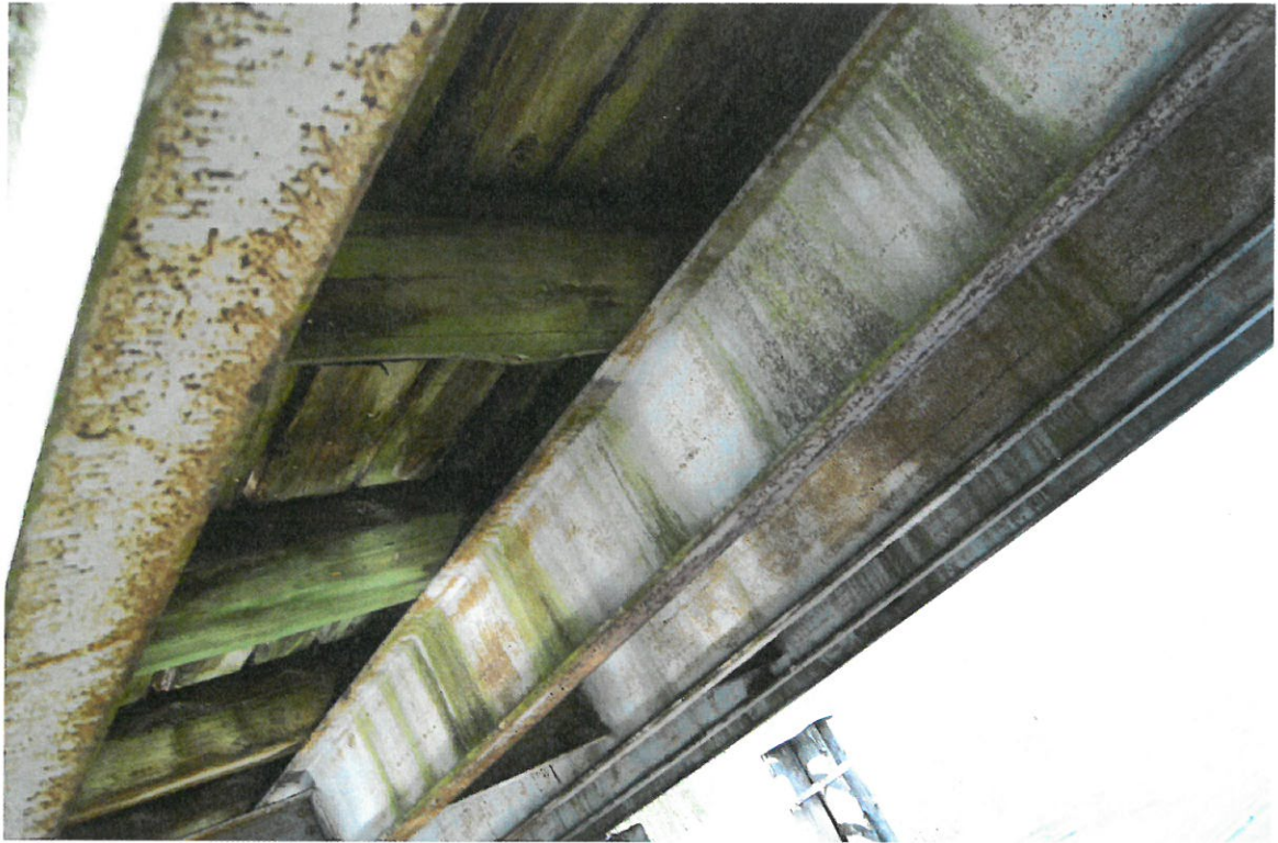
Fot. 3. Widok mostu od spodu