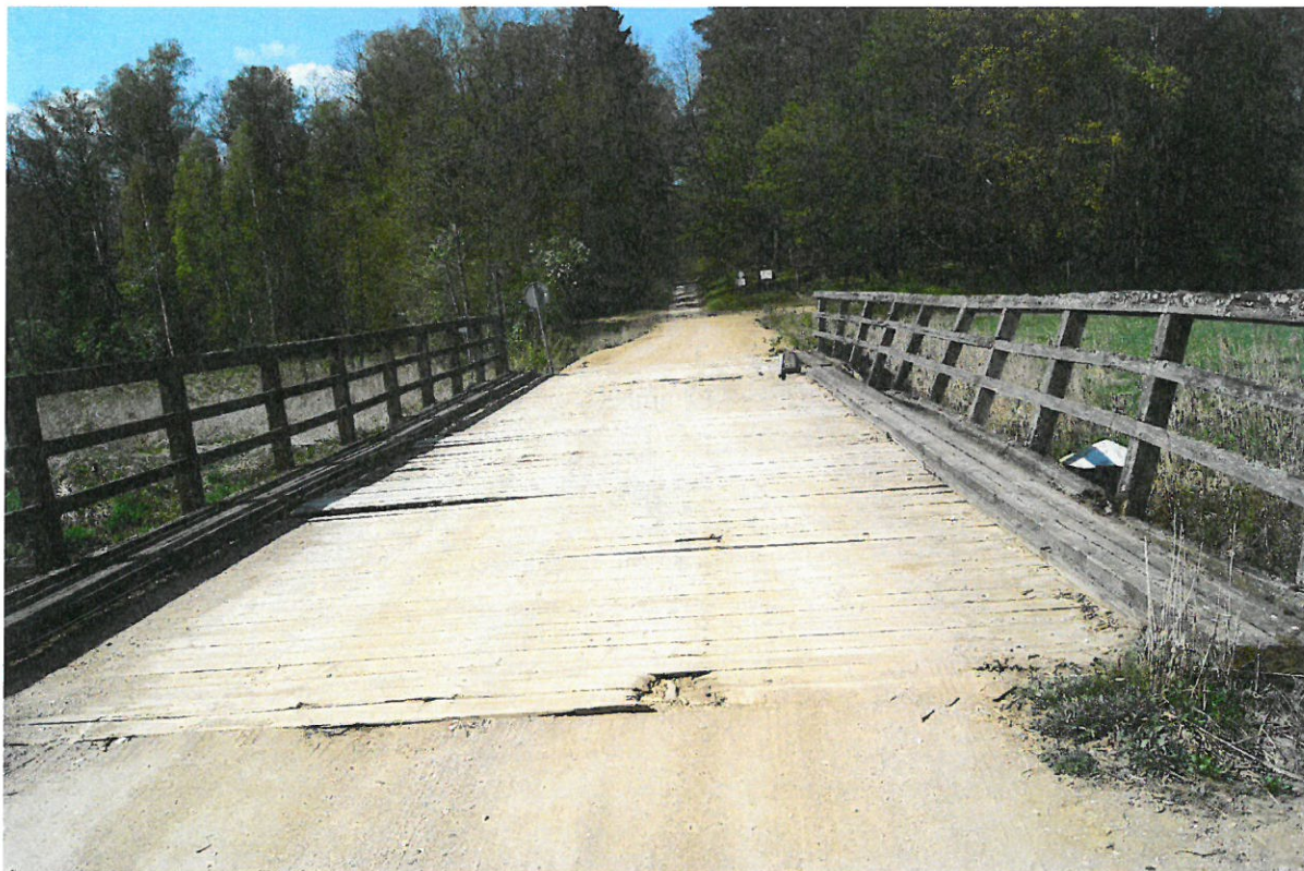
Fot. 1. Widok mostu od strony najazdu