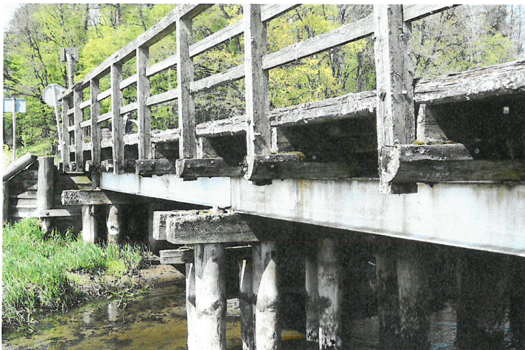
Fot. 7. Na poręczach drewnianych widoczne zanieczyszczenia i mchy – brak impregnacji drewna i prac bieżącego utrzymania. Na podporach pośrednich widoczna jest barwica (tzw. sinizna) i pleśnienie prawdopodobnie wywołane przez grzyby.