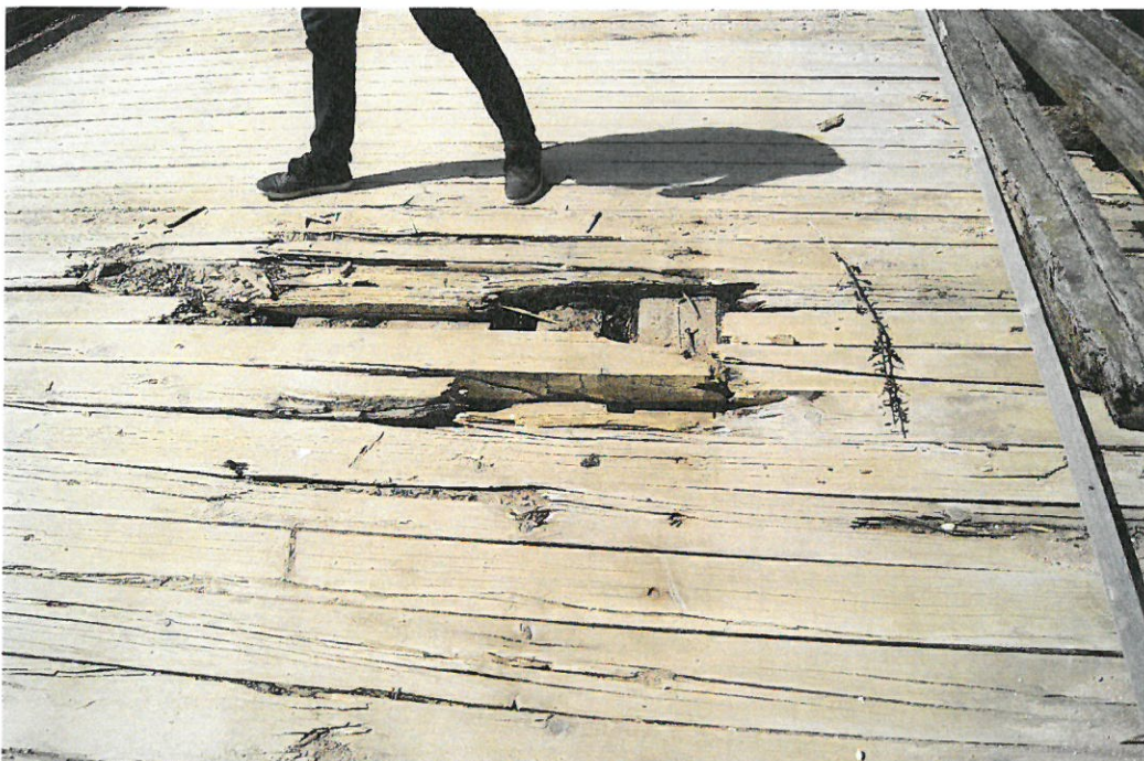
Fot. 5. Ubytek materiału pokładów drewnianych oraz liczne spękania, rysy pomostu