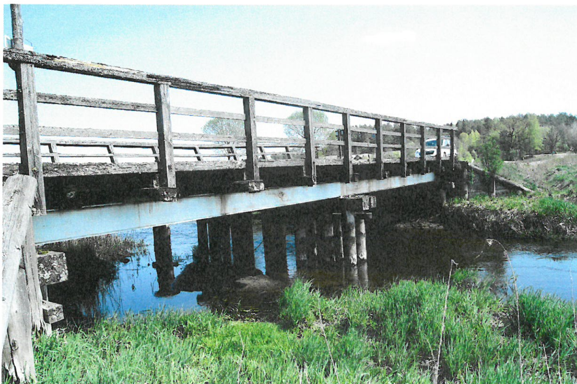
Fot. 2. Widok mostu z boku