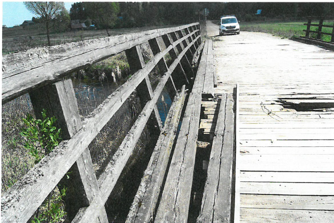
Fot. 6. Korozja biologiczna, gnicie, ubytki, pęknięcia, zmurszenie na poręczach drewnianych. Widoczne są też zanieczyszczenia, zacieki, mchy na belce podporęczowej. Widać wyraźnie przemieszczenie (odchylenie) poręczy.